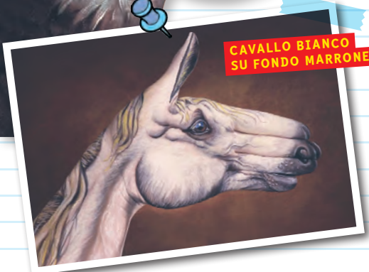
CAVALLO BIANCO SU FONDO MARRONE

«Una volta: mi disegnai a sinistra un elefante, per un'azienda di orologi, ma fu un'eccezione, per lavorare mi servono entrambe le mani!»